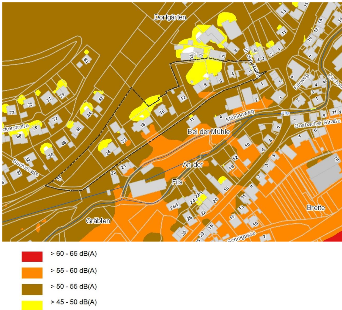
Abb. 2 Straßenverkehrslärm Nacht, Lärmkartierung BW 2017.

Die Werte für den Nachbereich liegen zwischen 50-55 dB(A) und in geringen Bereichen auch bei 55-60 dB(A).