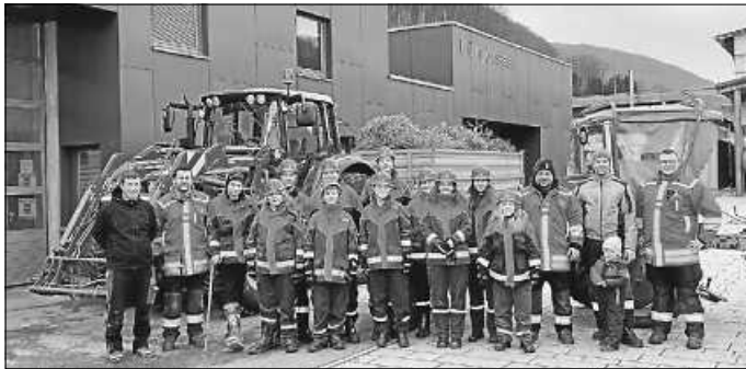
Foto: Gruppenbild Sammlung 2023