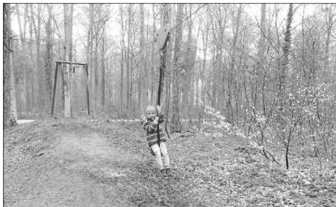
Als Belohnung gab es dann trotz der kühlen Temperaturen im Eiscafé noch eine Kugel Eis für jedes Kind.