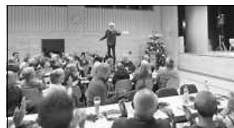
Heino auf dem Tisch

als Heino auf einer Tischreihe. Musikalisch rundet die Musik-Gruppe Mühlhausen i.T. die Unterhaltung ab.