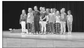
Die kleinen Künstler

sen die Senioren nach dem ersten Programmpunkt mit Kaffee und Tee.