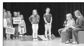
„Landung in Frankreich“