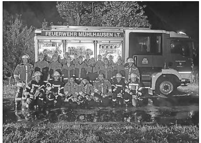
Gruppenbild Jugendfeuerwehr und Betreuer

die Bereitstellung des Firetrainers, bei der Jugendfeuerwehr Wiesensteig für die tolle Zusammenarbeit und bei allen teilnehmenden Jugendlichen an der Übung.