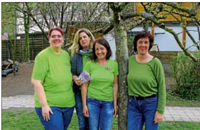
Die Kinder und ihre Erzieherinnen

sowie die vielen Arbeitsstunden des Teams, damit der Basar jedes Mal ein Erfolg wird, sagen wir herzlich Danke.