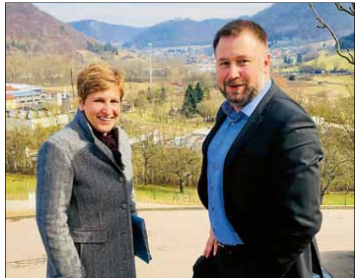
Gemeinde Mühlhausen i. T. Landkreis Göppingen