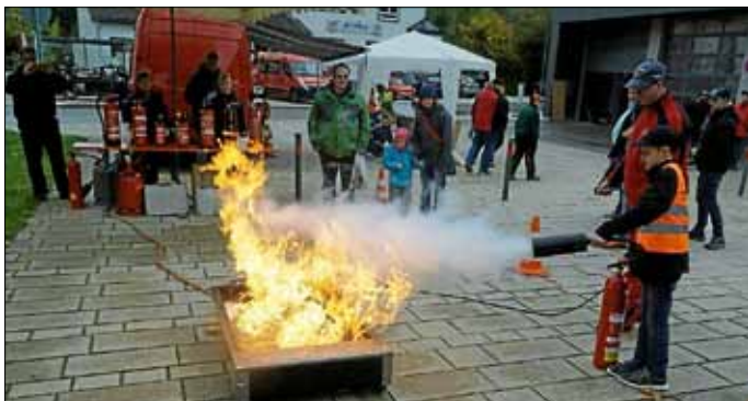
Der gemeinsame Bauhof des Interkommunalen Zweckverbands stellte seine Fahrzeuge und Gerätschaften am alten Klärwerk aus und die Gemeindeverwaltung hatte ihre Räum-

Aber auch die kommunalen Einrichtungen und Organisationen sowie unsere Kooperationspartner hatten sich am Sonntag in besonderer Weise präsentiert. So fand man rund um das Feuerwehrmagazin sämtliche Informationen und Aktivitäten zu unserer Freiwilligen Feuerwehr mit einem vielfältigen Programm. So hatte die Jugendfeuerwehr ein eigenes Fahrzeug der Landesfeuerwehrschule zum Vorzeigen und Ausprobieren. Aus alten Schläuchen wurden Schlüsselanhänger gebastelt. Die historische Feuerwehrpumpe war zu bestaunen, ebenso wie die neue gemeinsame Sandsackabfüllmaschine der Gemeinden im Oberen Filstal. Außerdem fanden immer wieder Feuerlöschvorführungen statt.