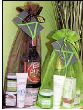
Albtraufsäckle in verschiedenen Variationen.