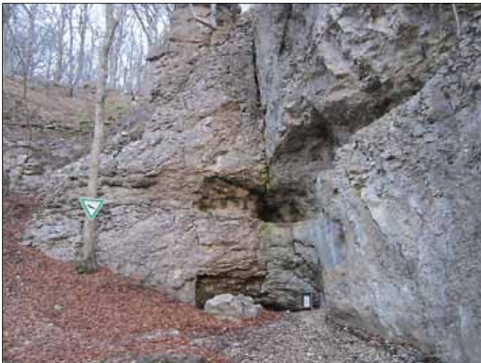
Zugang Todtsburger Höhle, Gemeinde Mühlhausen im Täle

Während der Zeit, in der die Höhlen normalerweise zugänglich sind (Anfang April bis Ende September) ist die Todtsburger Höhle ein beliebtes Ausflugsziel. Dieses Jahr müssen die Höhlen aus Sicherheitsgründen geschlossen bleiben. Wir bitten hierfür um Verständnis.