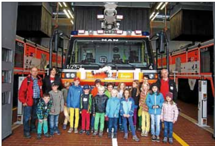
Besonders angetan waren die Teilnehmer/Innen und Betreuer von den Feuerwehrautos am Stuttgarter Flughafen

Im Rahmen des Schülerferienprogramms besuchte der Heimatverein den Flughafen Stuttgart.