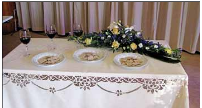
Fotolegende Wie im 1. Jahrhundert werden Brot und Wein bei der Gedenkfeier gereicht

Eine persönliche Einladung zu diesen Anlässen werden Sie wahrscheinlich bereits in den Tagen davor von einem Zeugen Jehovas an Ihrer Haustür erhalten. Informationen über die Gedenkfeier in Ihrer Nähe finden Sie auch auf www.jw.org/de/jehovas-zeugen/zusammenkuenfte/ .